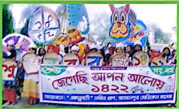
বর্ষবরণ ১৪২২ এর বর্ণাঢ্য র্যালীতে ছাত্র-ছাত্রীবৃন্দ