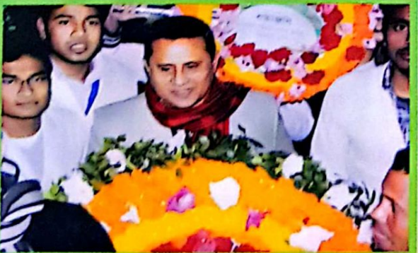
বিজয় দিবস/ ২০১৫ তে পুষ্পস্তবক অর্পণ করছেন অধ্যক্ষ মহোদয় এবং ছাত্র-ছাত্রীবৃন্দ