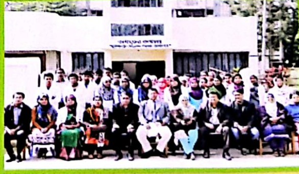
অধ্যক্ষ মহোদয় ও শিক্ষক-শিক্ষিকাবৃন্দের সাথে ১ম ব্যাচের ছাত্র-ছাত্রীবৃন্দ