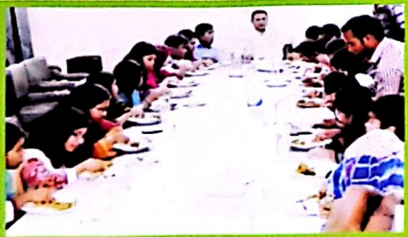
মাসিক প্রীতিভোজে অধ্যক্ষ মহোদয়ের সাথে ১ম ব্যাচের ছাত্র-ছাত্রীবৃন্দ