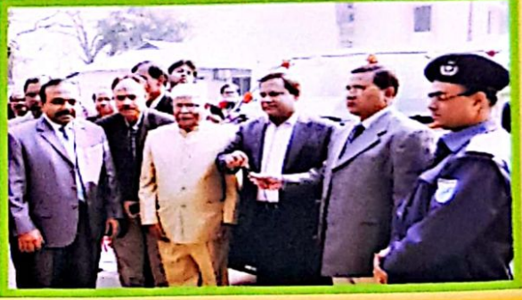
জামালপুর মেডিকেল কলেজে প্রদত্ত গাড়ীর চাবি অধ্যক্ষ মহোদয়ের নিকট হস্তান্তর করছেন মাননীয় বস্ত্র ও পাট প্রতিমন্ত্রী জনাব মির্জা আজম এমপি