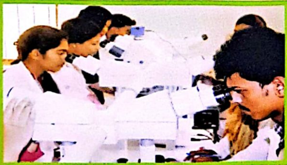
ল্যাবরেটরীতে অধ্যয়নরত ছাত্র-ছাত্রীদের একাংশ